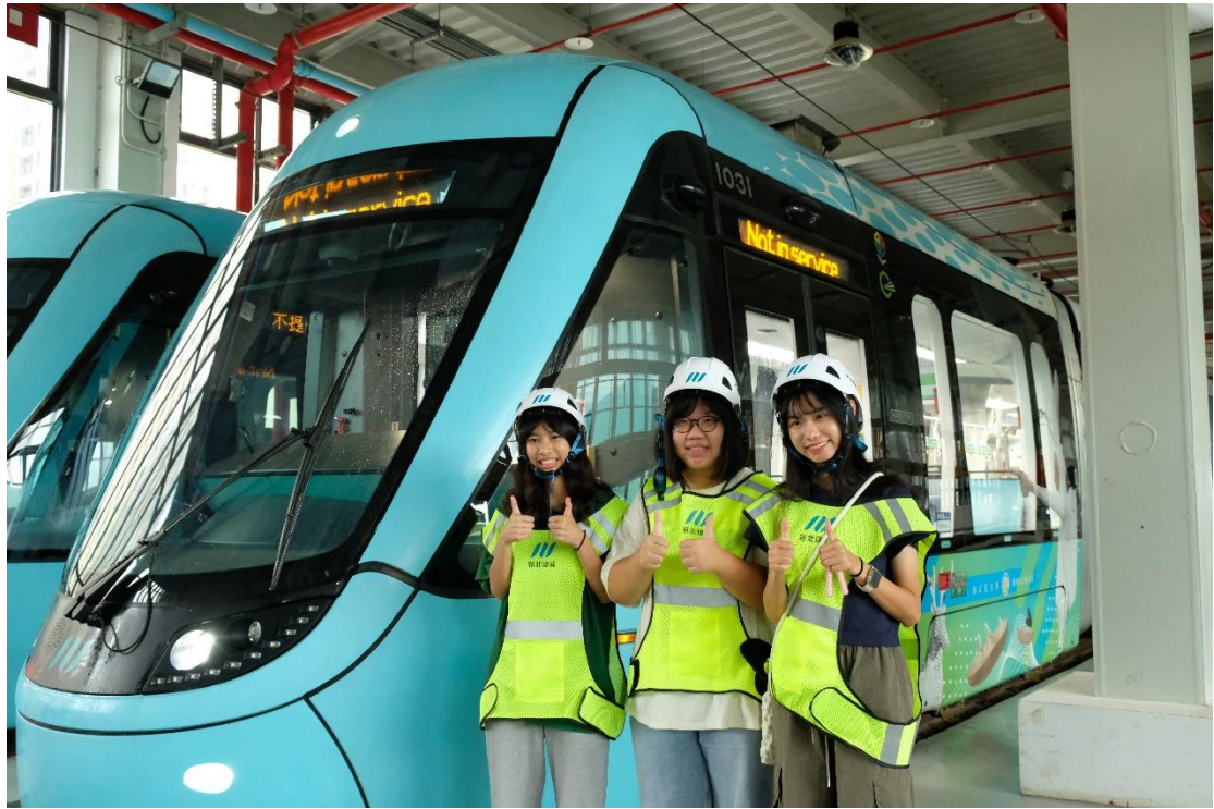
圖四 青年運輸營:淡海輕軌機廠工程參訪