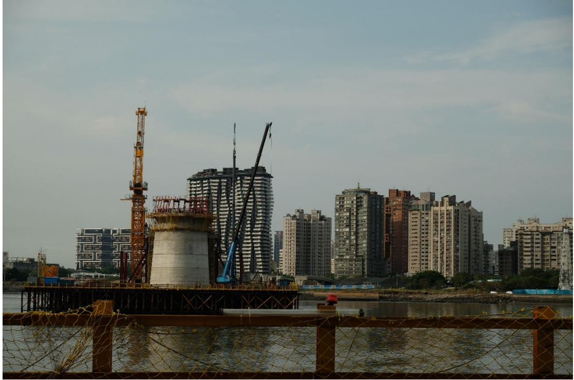
圖二 青年運輸營:淡江大橋工程參訪