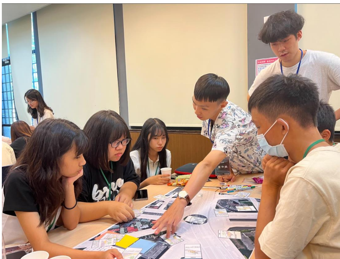
圖一 青年運輸營:道路標線工作坊