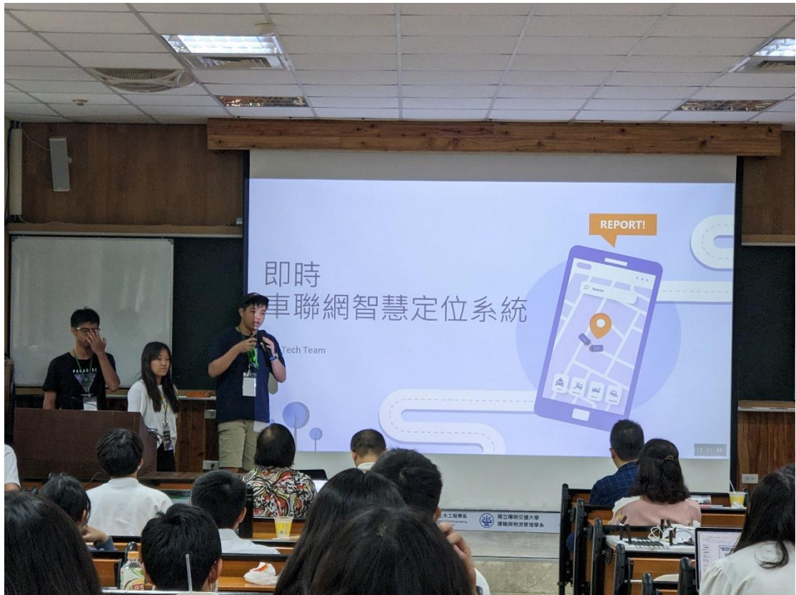
圖五 青年運輸營:決賽評審簡報